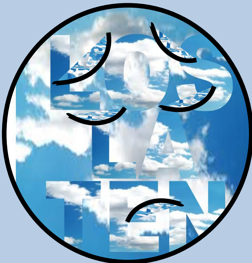
Loslaten. Digitale fotobewerking AD