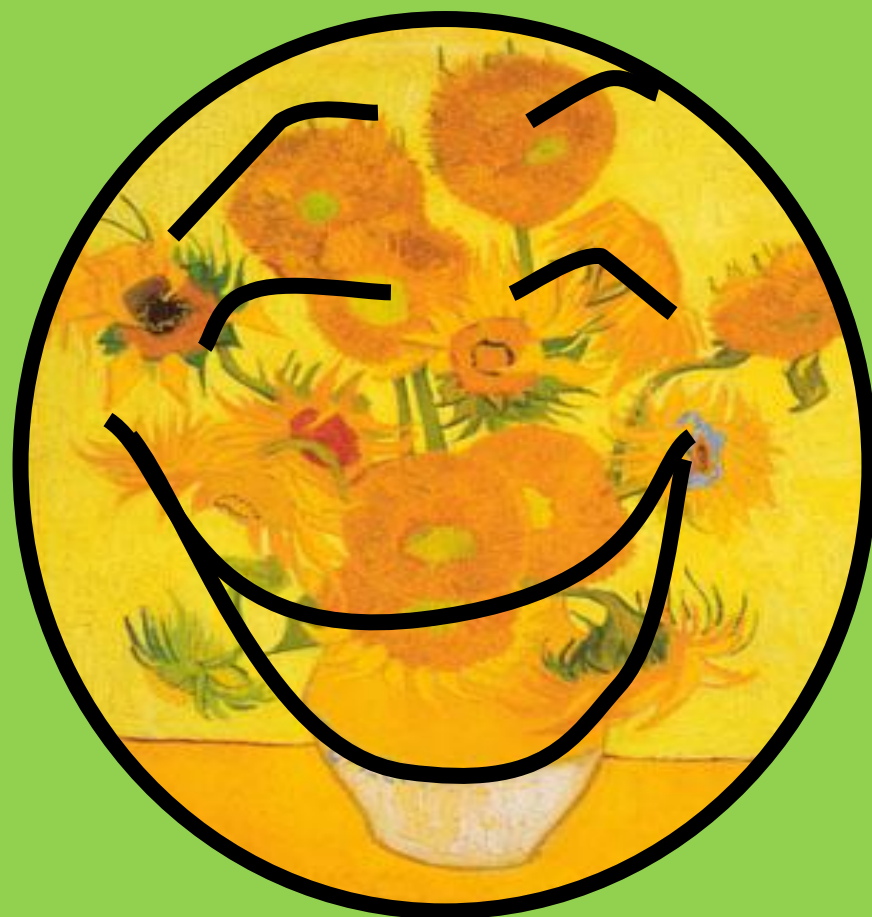
Zonnebloemen Olieverf Van Gogh

Ze had velden vol zonnebloemen gezien en een prachtig schilderij van Van Gogh